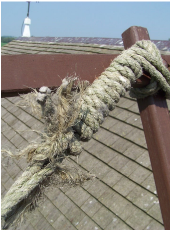
Gerafeld touw door kauwen.