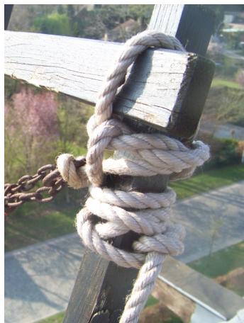
Vernieuwd touw met roestige ketting en harpsluiting.