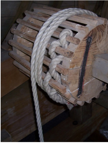
Vangtouw met 3 slagen rond en geweven in de trommel.