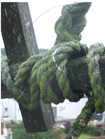
Bemost touw, grondig nakijken en zo nodig vervangen.

Touwen worden in de molen gebruikt om materialen te bevestigen zoals luiken, maar ook voor het regelen van de werking, het lichtwerk en om de molen te bedienen. Het is belangrijk om de touwen tijdig te controleren om de molen in de hand te houden.