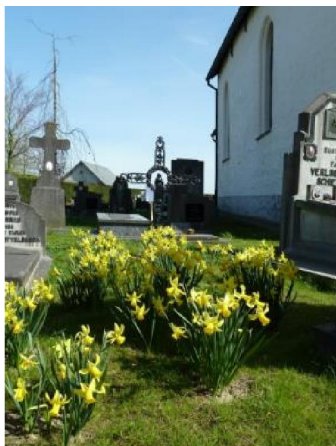
Bloemen fleuren de begraafplaats op; helpen tegen erosie en zijn niet schadelijk voor de graftekens

Bepaalde perken/zones kunnen een bodembedekker of bloemenweide krijgen waardoor ze zich onderscheiden van de overige delen.