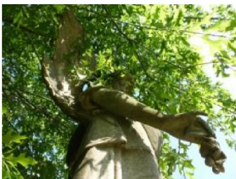
Snoei bomen regelmatig opdat zwiepende takken beelden en graftekens niet beschadigen