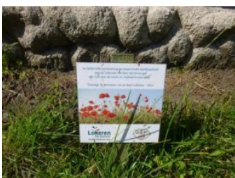
Een ingezaaid bloemenmengsel kan de belevingswaarde versterken