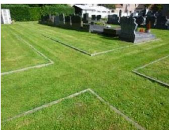
De ondergrond van veel belopen graspaden verstevigen.

Om de beleving van een begraafplaats te versterken, kunnen aangepaste beplantingen voorzien worden. Bomen en heesters met een symbolische betekenis en stinsenbeplantingen kunnen variatie brengen in de natuurlijke aanblik en meerdere belevingsmomenten – naast Allerheiligen – creëren.