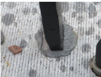
Zorg ervoor dat de loodprop goed aansluit, zowel met het metaal als met de natuursteen, zodat er geen vocht kan indringen.