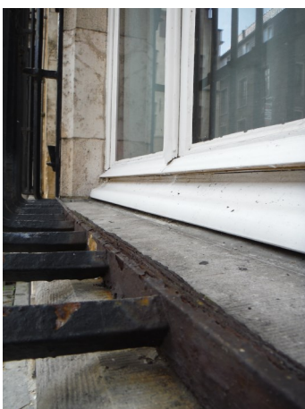
Vooraf plaatsen waar water blijft staan, zijn gevoelig voor corrosie.