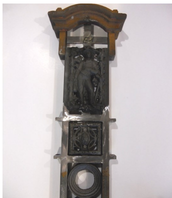
Stijl van smeedijzeren hekwerk gedemonteerd in atelier voor een behandeling. Onderdelen worden opnieuw gelast en nadien vlak geschuurd.